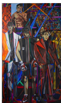
Raphaëlle Benzimra, PORTRAIT DE DMITRY BIVOL , 2024, huile sur toile, 195 x 114 cm.