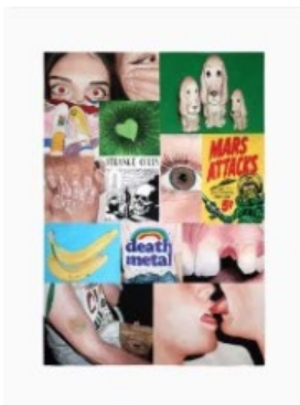
Léo DORFNER, Strange Cults , 2022, aquarelle sur papier, 160 x 120 cm.

Courtesy de l'artiste et Perrotin. Production Frac Île-de-France. Photo : Tanguy Beurdeley ©Adagp, Paris, 2026