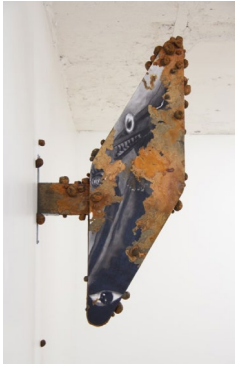
Tristan CHEVILLARD, La gorge du dragon (Post-industrial effigy) a tribute to Gyaos , 2025, matériaux mixtes, dimensions variables.