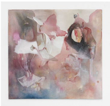
Mathilde DENIZE, Sound of Figures , 2025, acrylique et aquarelle sur toile, paillettes, 200 x 180 cm.

Courtesy de l'artiste et Perrotin. Production Frac Île-de-France. Photo : Tanguy Beurdeley ©Adagp, Paris, 2026