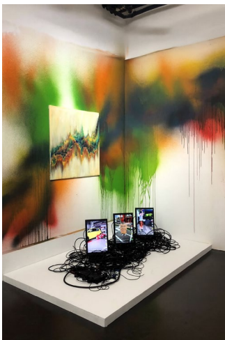
Pierre PAUZE, Draw me a bull , 2025, huile sur toile, 150 x 150 cm ; peinture murale, 3 écrans, câbles, dimensions variables.

Collection privée.