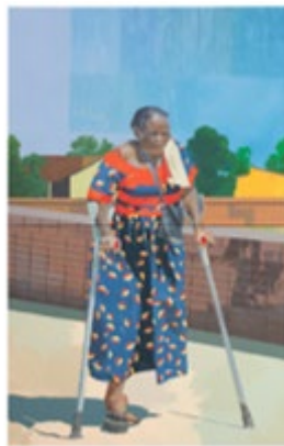
David MBUYI, Miroir , 2023, huile sur toile, 228 x 146 cm.

Courtesy de l'artiste et mor charpentier. Photo : Aurélien Mole ©Adagp, Paris, 2026