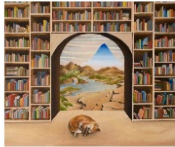
Zélie NGUYEN, La bibliothèque de babel , 2023, huile sur bois, 46 x 38 cm.