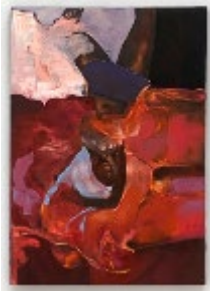
Clémence GBONON, Secret Gardens , 2024, huile sur toile, 116 x 89 cm. Collection privée.