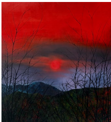
Fabien CONTI, Soleil rouge , 2025, huile sur toile, 200 x 180 cm.