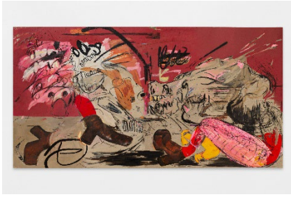
Dora JERIDI, PONY CLUB (GUERNICA FOR KIDS) , 2023, huile, bâton d'huile et fusain sur toile, 210 x 400 cm.