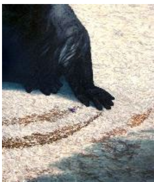
Blaise SCHWARTZ, Mouvement au sol , 2023, huile sur toile, 100 x 80cm.