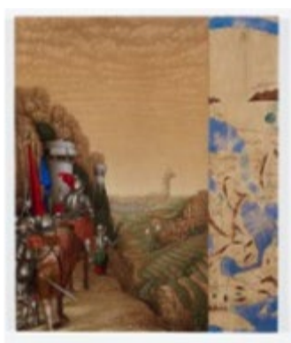
Rayan YASMINEH, Le siège , 2025, huile sur bois, 46 x 38 cm.