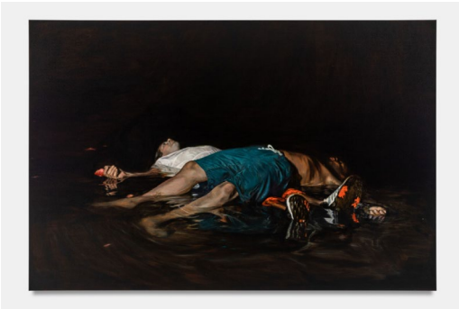
Bilal HAMDAD, L'horizon II , 2023, huile sur toile, 162 x 230 cm. Collection Francès.