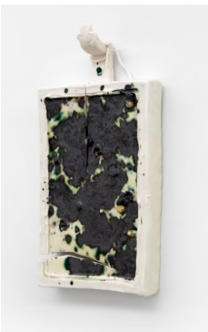
Nina JAYASURIYA, Série Les trésors du futur , 2023-en cours, porcelaine émaillée, métal, dimensions variables.